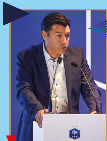
Hubert Fournier Directeur technique national FFF

Ainsi, la FFF a conçu une filière de formation à destination de ses clubs et de ses éducateurs.trices basée sur deux parcours distincts. Un parcours « bénévole » à destination des éducateurs qui souhaiteraient participer à la vie du club et un parcours « professionnel » pour ceux qui souhaiteraient faire de cette fonction leur véritable métier. Composée de formations permettant d'encadrer tous types de publics et de pratiques, cette nouvelle filière répondra aux besoins et aux enjeux de toutes et tous quel que soit leur projet.